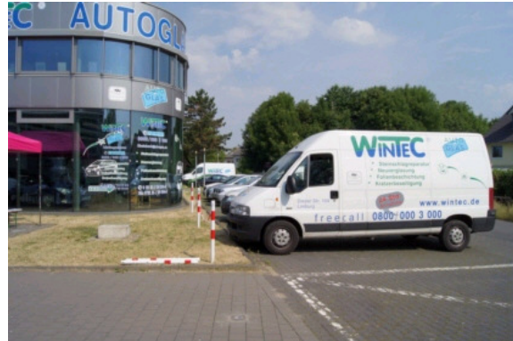
Blick auf das Wintec Schulungszentrum

Bei schönstem WM-Wetter, am Tag des Viertelfinales, trafen sich die Bewerber zum ersten Vorentscheid in Rheinbach in der Nähe von Bonn. Im Wintec Schulungszentrum, ideal auf dem Gelände des imposierenden Gebäudekomplexes der Glasfachschule gelegen, war für den fairen Wettbewerb alles bestens vorbereitet.